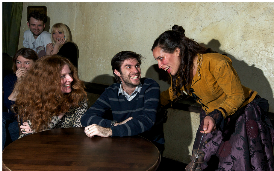
Abbildungen 1 und 2 : (The Dungeon:

http://www.thedungeons.com/london/en/misc/press.aspx , 17.12.2014, 12:34 Uhr)