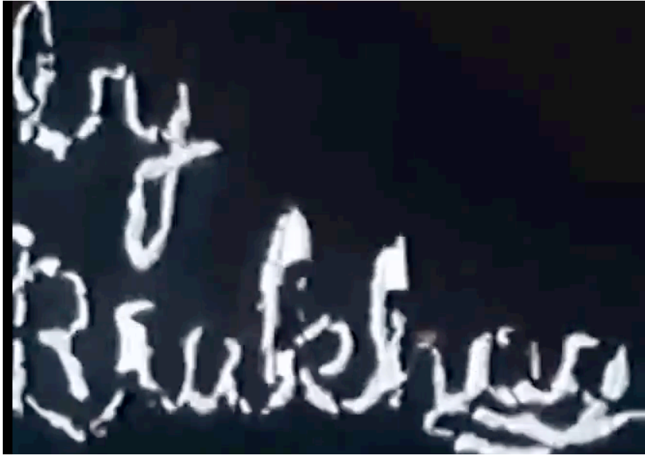
Filmstill aus Mothlight , 3'09'' 196

Doch der intentionale Akt, in dem Brakhage seine Unterschrift setzt, geht nicht ganz (in Intentionalität) auf. Die Unverwechselbarkeit der Signatur ist ebenso dem Akt ihrer Produktion geschuldet. Die Einschreibfläche ist nur wenige Quadratmillimeter groß und so wird jede Unschärfe der Hand, jede kleinste Erschütterung des Körpers, aufgezeichnet. Der Körper des Künstlers mit all seinen „pulsions and drives“ ist den materiellen Gegebenheiten seines Mediums unterworfen. Das Ergebnis ist autobiographisch in einem buchstäblichen Sinn. Genau hier entsteht dieses „Mehr an Sinn“, das sich laut Gabriele Jutz der „willentlichen Beherrschung durch das Subjekt entzieht.“ 197 Der handmade Film verweist auf die Grenzen des Intentionalen, denn seine physische Herstellungsweise bedingt, „dass er niemals vollständig dem Willen des Äußerungssubjekts unterworfen ist, sondern stets über das Intendierte hinausgeht und daher einen Überschuss an Sinn produziert.“ 198